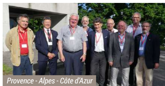
Provence - Alpes - Côte d'Azur