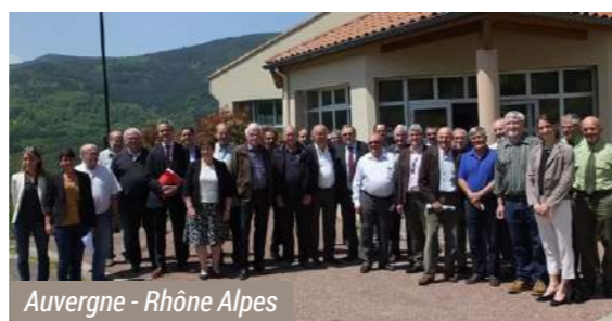
Auvergne - Rhône Alpes