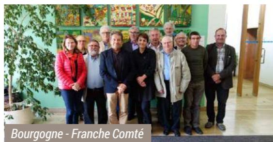
Bourgogne - Franche Comté