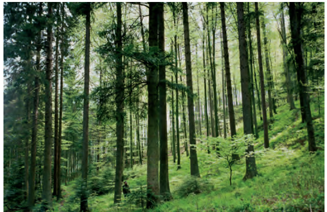
Forêt de la Grande Chartreuse, Isère

Près d'un tiers de la France est couvert de forêt.