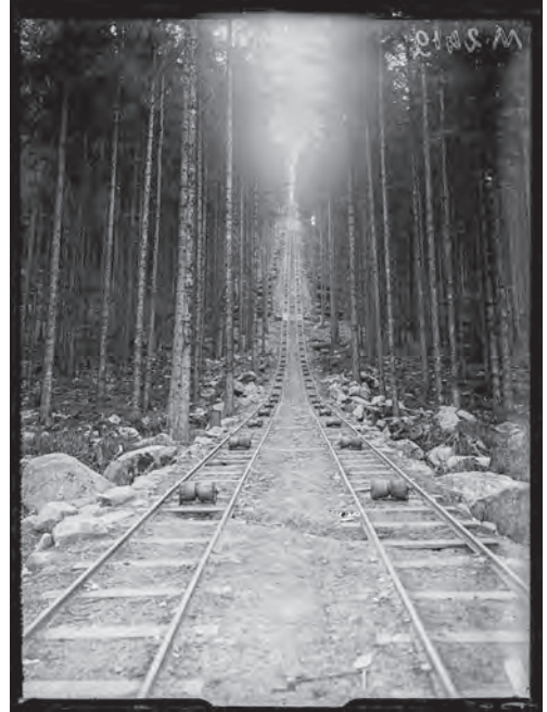
Trouée pour l'évacuation des bois sur voies de 60 dans la forêt vosgienne, août 1916.