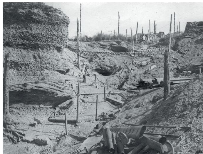
Tranchées aux Rochers du col de la Chapelotte dans les Vosges.

Arbres abattus, éclatement des troncs, bois mitraillé, des zones entières sont dévastées par les combats.