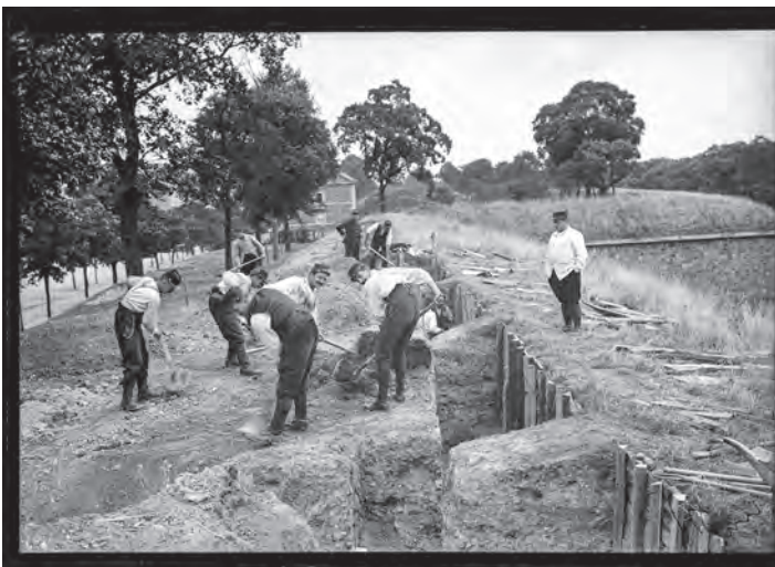
Construction d'une tranchée allant de la porte de Châtillon à Charenton - Juillet 1915

Le périmètre défensif autour de Paris atteint 160 km.