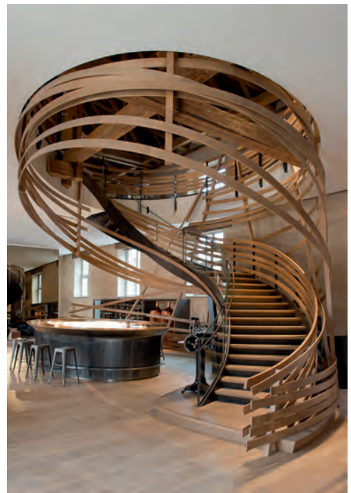
Brasserie Les Haras, Strasbourg

Allier le bois à d'autres matériaux (verre, métal) est une tendance forte de l'aménagement intérieur.