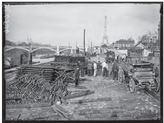
Déchargement du bois sur les quais de Paris, octobre 1917.

Les coupes et le transport du bois mobilisent beaucoup d'hommes. Au début de la guerre, l'exploitation des forêts s'organise dans l'urgence : il faut répondre à la très forte demande du front, or les chasseurs forestiers sont au combat. Des menaces de surexploitation pèsent sur la forêt. Les forestiers donnent l'alerte et dès mai 1915, une ordonnance crée les centres d'approvisionnement en bois. En 1917, le Comité général des bois est installé puis le ministre de l'Agriculture met en place les Services forestiers d'armées (SRA). En parallèle, les soldats américains, les bûcherons canadiens, maoris ou d'autres nationalités viennent appuyer les forestiers français.