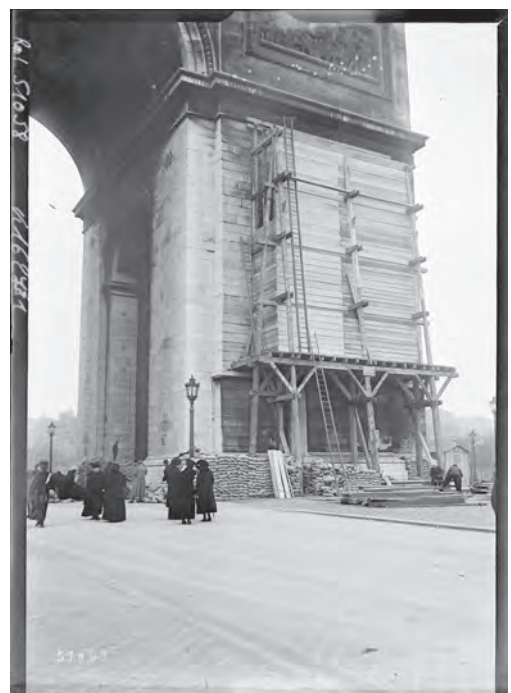
Protection de l'Arc de Triomphe