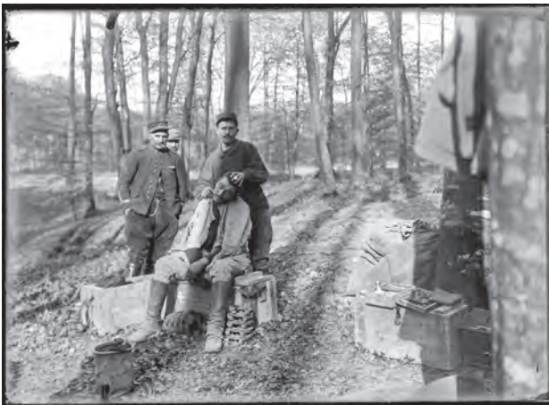
Barbier, port de Berne, forêt de Compiègne, Oise

Le quotidien des soldats en forêt s'organise avec les moyens du bord.