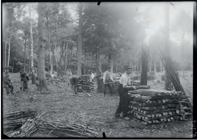
Bois calibrés pour les tranchées, forêt de L'Isle-Adam, août 1915

Les besoins en bois sont énormes, les coupes et le transport du bois mobilisent beaucoup d'hommes.