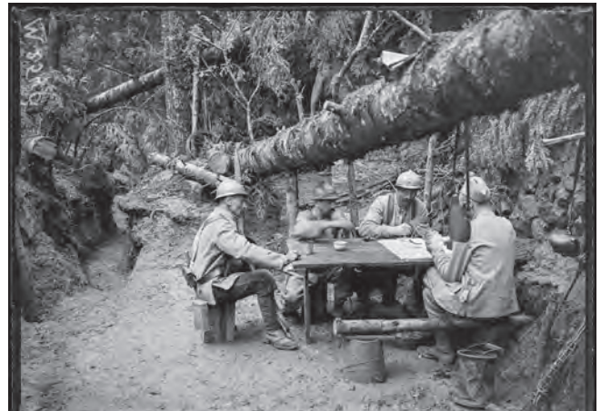
Soldats jouant aux cartes dans une tranchée, Vosges, août 1916