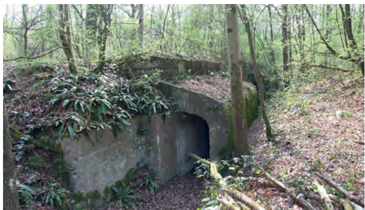
Abri bétonné en forêt domaniale de Notre-Dame, Seine-et-Marne

La plupart des vestiges du camp retranché de Paris sont conservés en forêt.