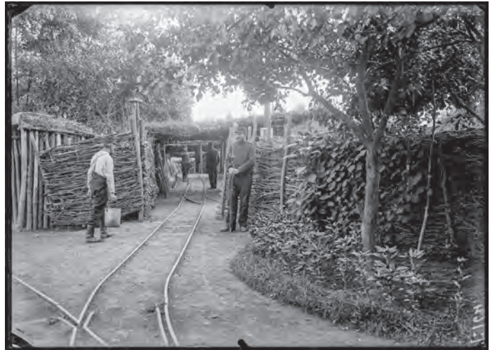
Voie de 60 vers la batterie 113 renforcée par des clais de bois, Montigny-lès-Cormeilles (95).

Pour approvisionner les tranchées, les soldats construisent des « voies de 60 », voies de chemin de fer très étroites, de 60 cm de large.