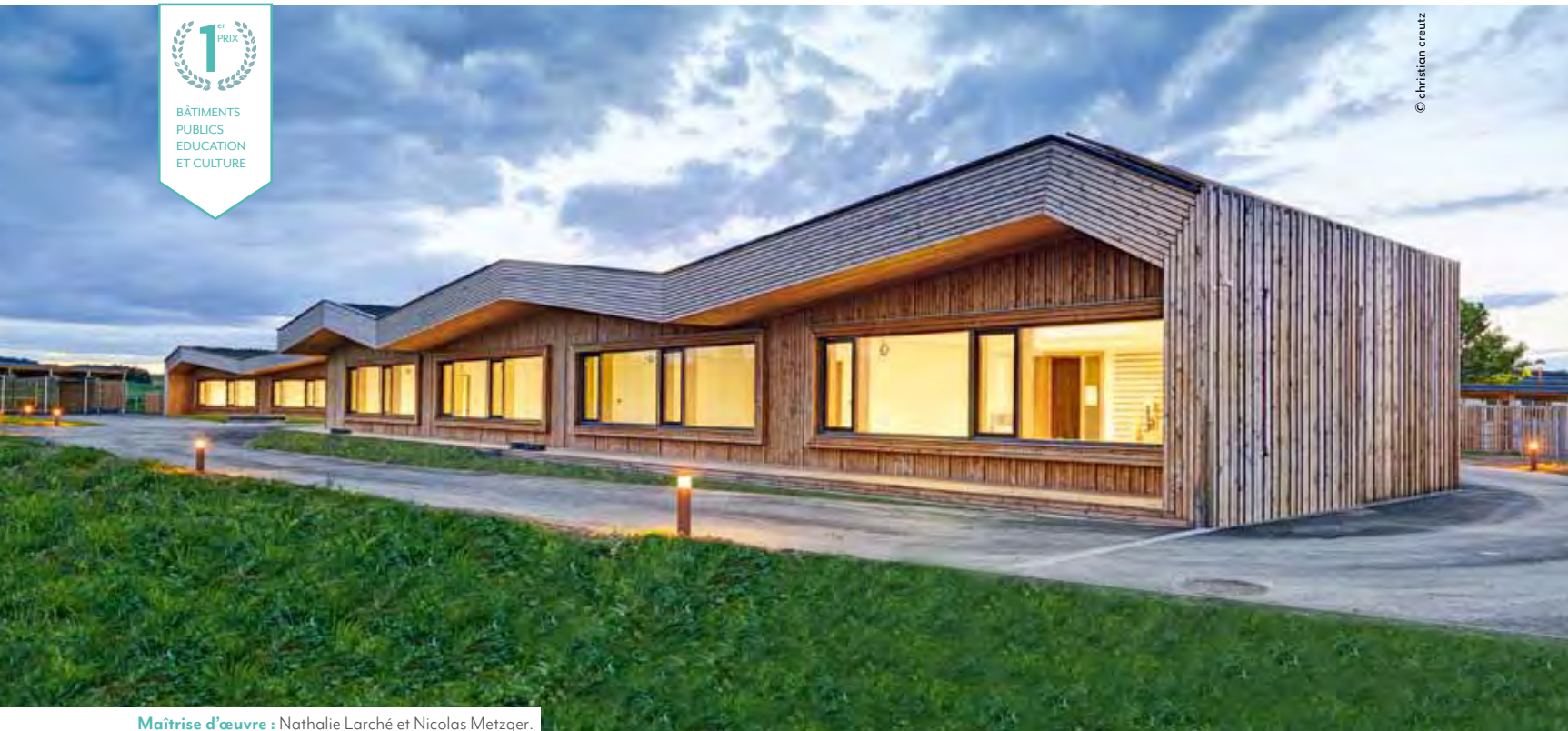
Maitrise d'œuvre : Nathalie Larché et Nicolas Metzger.

En quatre éditions et avec plus de 2 500 bâtiments présentés, le Prix national de la construction bois montre, en France, l'évolution de l'univers du bâtiment... et des mentalités. Présentation des lauréats 2015, d'un groupe scolaire lorrain bardé de douglas à un lycée nantais revêtu de pin.