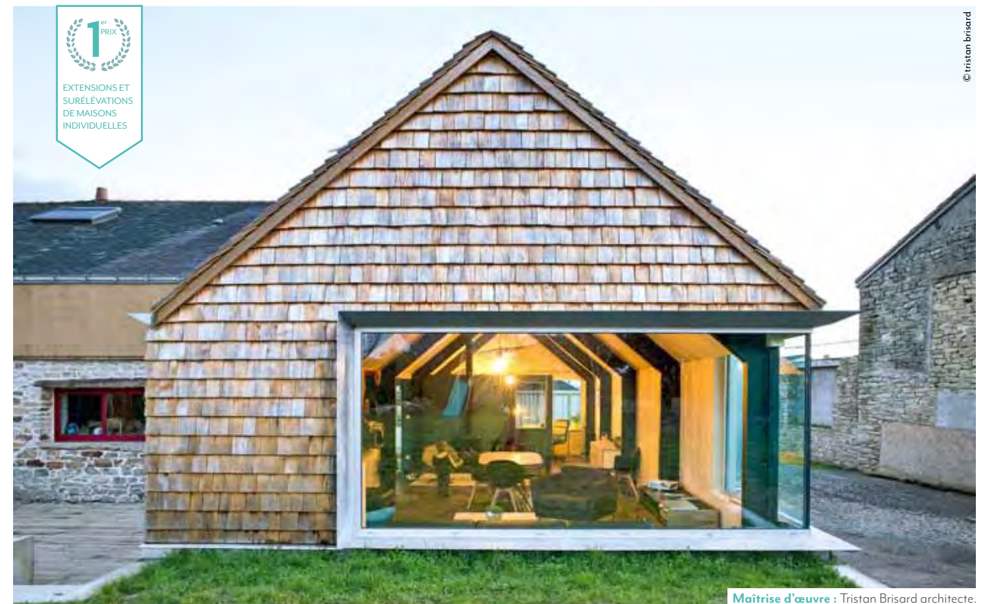
Maitrise d'œuvre : Tristan Brisard architecte.